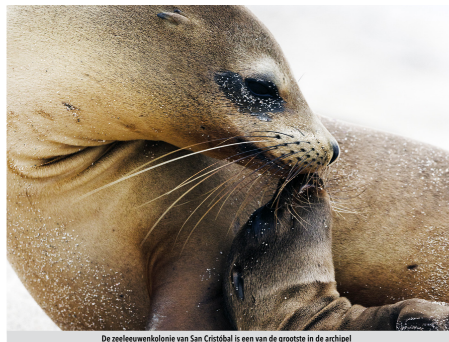
De zeeleeuwenkolonie van San Cristóbal is een van de grootste in de archipel