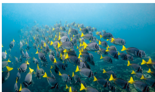
Geelstaart doktersvissen zijn regelmatige snorkelvrienden