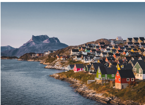
Nuuk, hoofdstad van Groenland, met prachtige kleine en kleurrijke huizen

Silversea Expeditions heeft een van de hoogste expeditie personeel-gast ratio's in alle expeditie cruises. Elke reis heeft een team van 20 tot 28 gekwalificeerde, meertalige specialisten - naturalisten, wetenschappers, ornithologen, gletsjerspecialisten - met expertise op maat van de natuur, de wildernis en de cultuur van een specifieke regio. Deze ervaren en getalenteerde professionals worden gekozen vanwege hun passie en toewijding aan hun gespecialiseerde vakgebied, maar ook voor hun openheid, vriendelijkheid en oprecht enthousiasme. Van het leiden van dagelijkse "Recap en briefing" lezingen en boeiende discussies aan boord tot het organiseren van alle excursies buiten het schip - met Zodiac, kajak, wandelen en meer - ons Expeditieteam is een essentieel onderdeel van jouw expeditiereis, het verheft je ontdekkingsstocht met gedeelde geheimen en fascinerende verhalen.