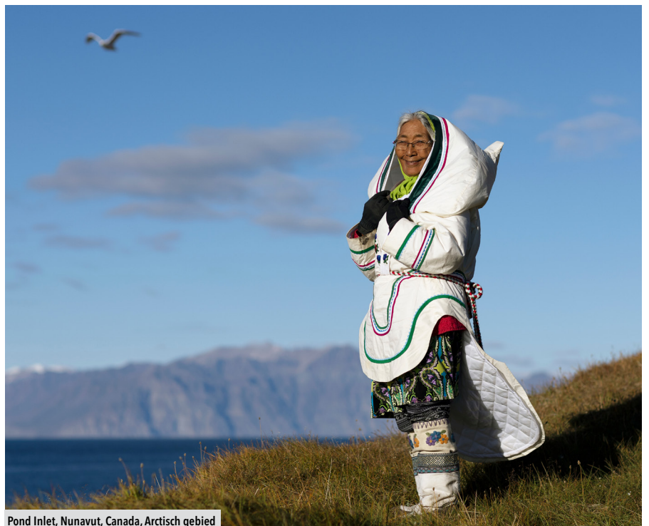
Pond Inlet, Nunavut, Canada, Arctisch gebied