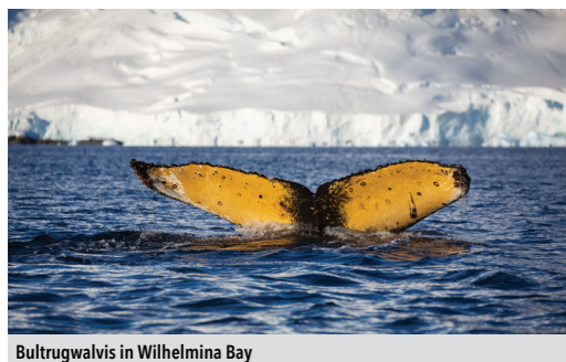
Bultrugwalvis in Wilhelmina Bay