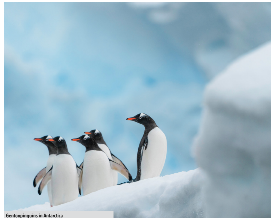
Gentooinguijn in Antarctica